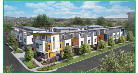
獨棟住宅/豪宅汙物廢水排放系統