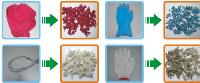
磨碎效果佳(上圖為各物件實際磨碎的效果)