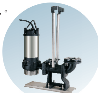
全系列可裝配著脫裝置