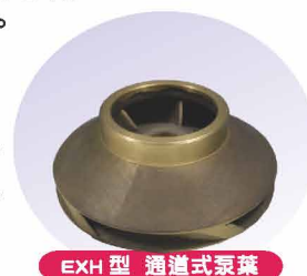
EXH 型 通道式泵葉